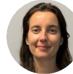
DEQUICK Audrey Jacobi carbons